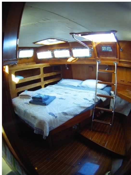
sehr große Eignerkabine