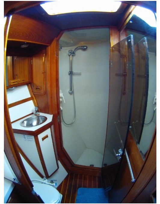
vorderes WC & Dusche